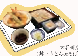
大名御膳 (丼・うどんorそば) ¥1,080