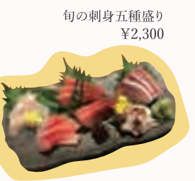
旬の刺身五種盛り ¥2,300