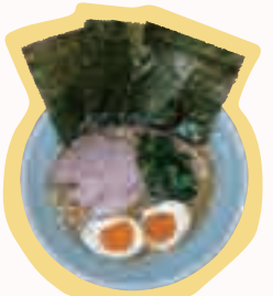
半熟味玉ラーメン(並) ¥750