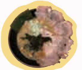
とんこつ醤油チャーシュー麺 ¥800