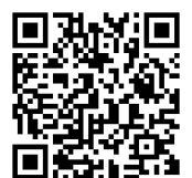
日吉キャンパス 陸上競技場